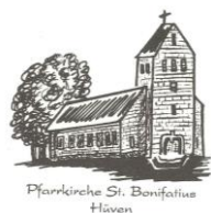
Pfarrkirche St. Bonifatius Hüven